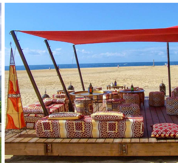
INSTALLATIONS SAISONNIÈRES / TEMPORAIRES