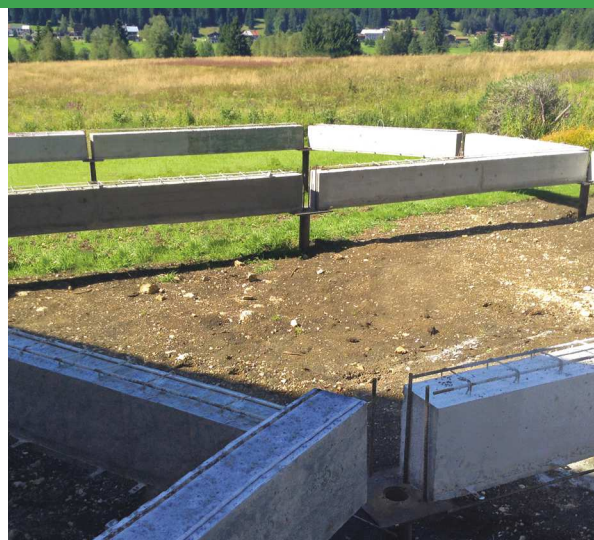
SUPPORTS LONGRINES BÉTON