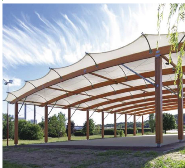
COUVERTURES DE TERRAINS