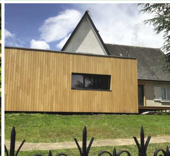
AGRANDISSEMENTS / VÉRANDAS / TERRASSES