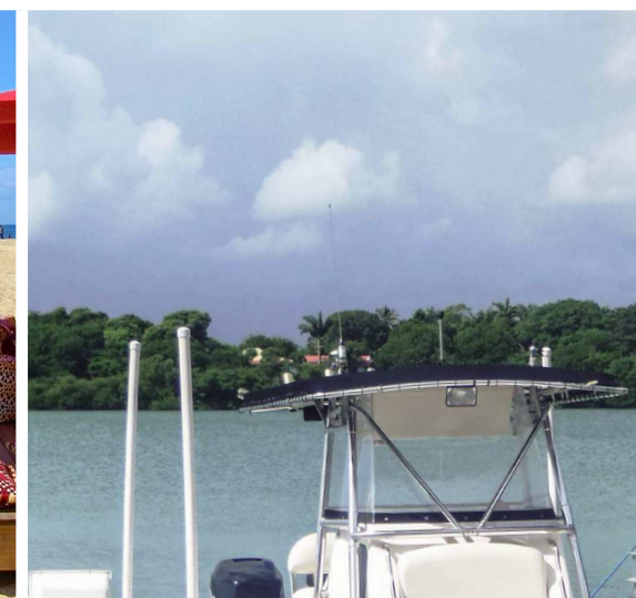
QUAIS / ASCENSEURS À BATEAUX