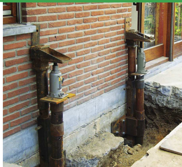
STABILISATION ET REDRESSEMENT DE FONDATIONS