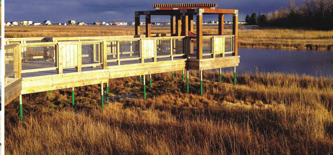
PASSERELLES / SENTIERS