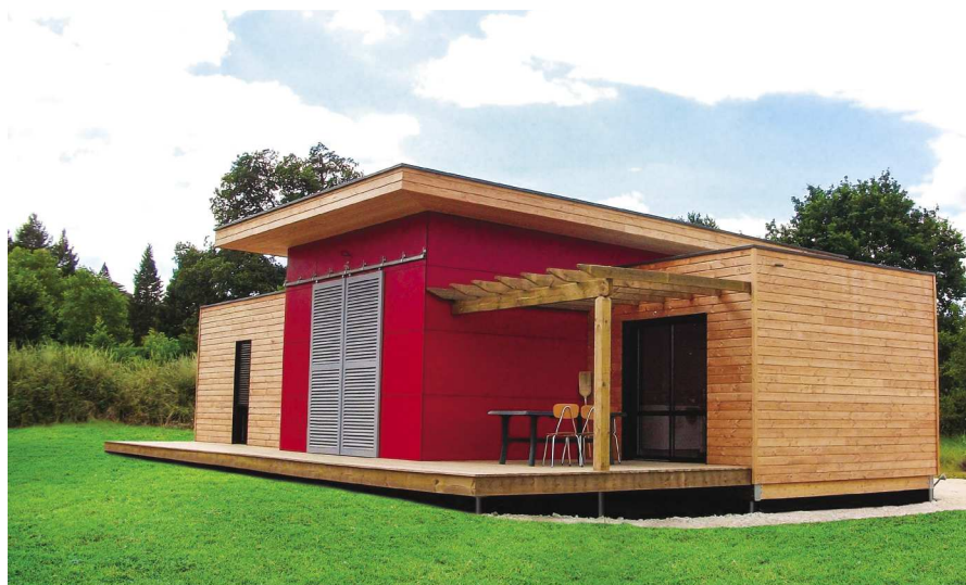
MAISONS OSSATURE BOIS