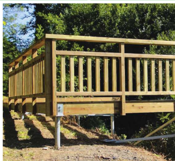
BELVÉDÈRES / PONTS